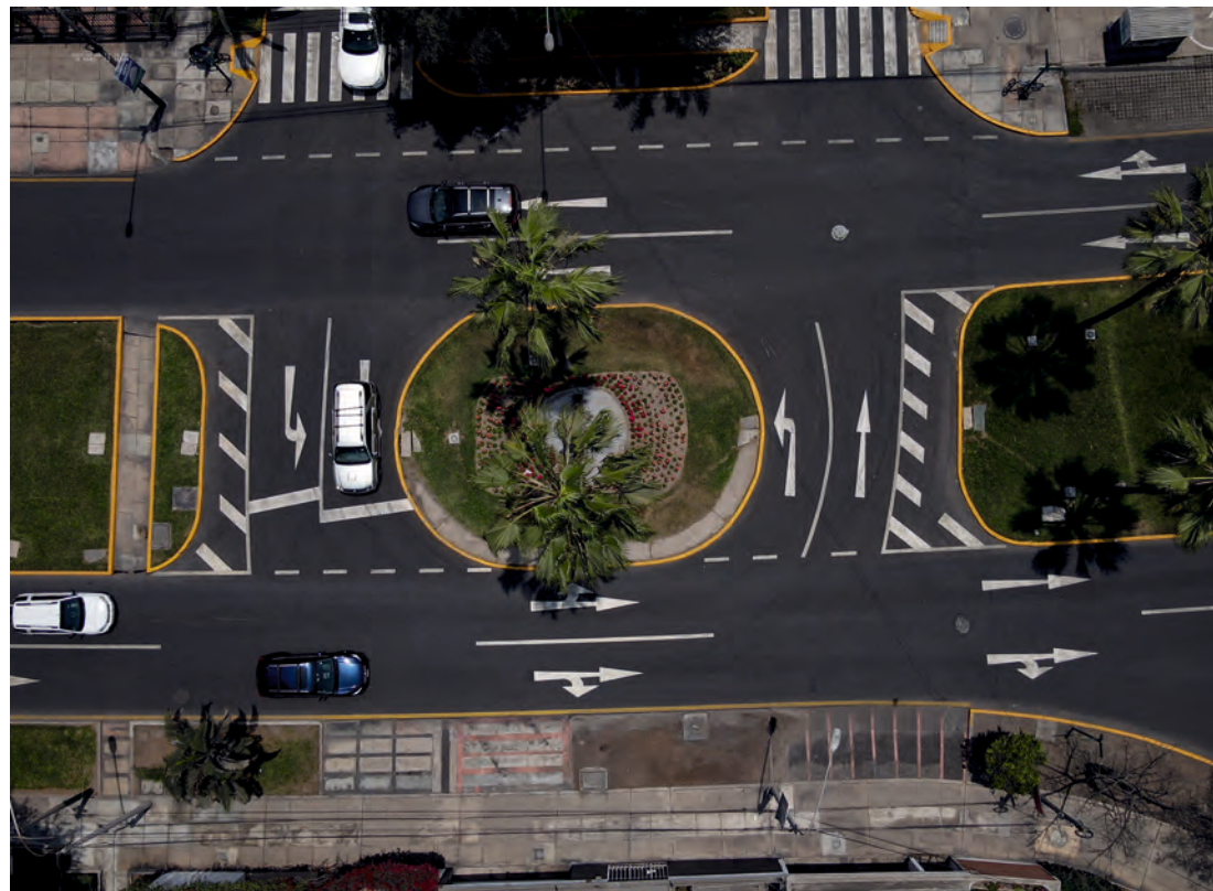
Otro ejemplo en Velasco Astete muestra como se incluye sardineles, veredas y áreas verdes.

to para escuchar sus necesidades, que también se recogen por oficios y redes. En esta reunión que tenemos directamente están todas las gerencias recogiendo el sentir de los vecinos. Esto baja a una matriz de necesidades en la que se prioriza y programa la ejecución, obviamente dentro de nuestro marco presupuestal. También tenemos cuadrillas propias que ya van bacheando, o tapando baches, por más de 7 mil kilómetros cuadrados. Y otro tanto en refacción de veredas, sardineles y rampas de acceso para personas con atenciones especiales. ■