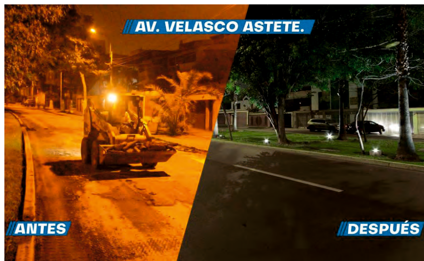
Solo en Velasco Astete la inversión superó los S/ 4 millones.

ticipación vecinal muy activa, que es la que se encarga de conectar las necesidades del vecino con las áreas operativas. Además, un día a la semana el alcalde recibe a los vecinos en diversos sectores del distri-