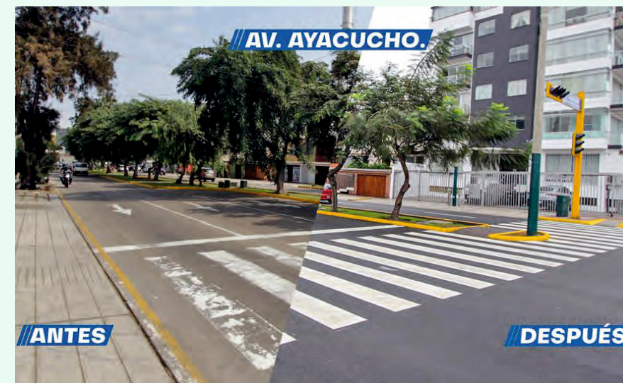
Son en total 13 vías metropolitanas que serán completadas de aquí a fin de año.

Se trata de una interesante vuelta de tuerca para un político que llega a la arena distrital tras un largo paso por la escena nacional, y no al revés. Como empresario en los sectores de construc-