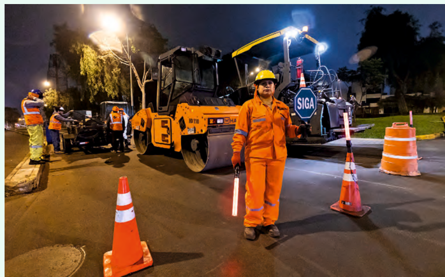
Obras también fueron realizadas en horario nocturno durante todo el año.

Ambicioso programa de pavimentado va mucho más allá de las pistas y posiciona a alcalde Carlos Bruce.