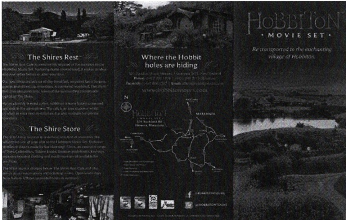
Hobbiton Movie Set.

Otro de los ejes que el país aprovecha como parte de los efectos positivos indirectos de la industria cinematográfica, es el turismo filmico, basado en ofrecer visitas a las locaciones donde se han filmado películas icónicas.